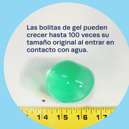
Las bolitas de gel pueden crecer hasta 100 veces su tamaño original al entrar en contacto con agua.